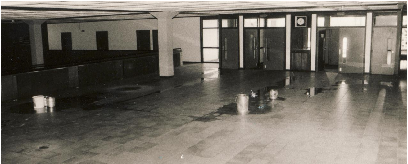
Es regnet durch, schon 1976. Links im Bild die legendäre „Blaue Grotte“