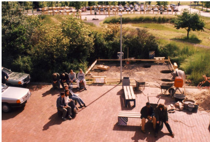
Gute alte Zeit? Bau des Raucherpavillons für Schüler*innen 1994

Die alte Raucherecke vor dem Hausmeisterbüro (die Generation Ü50 wird sich erinnern) war 1989 zugunsten der dynamisch geschwungenen Hochbeete abgebaut worden.