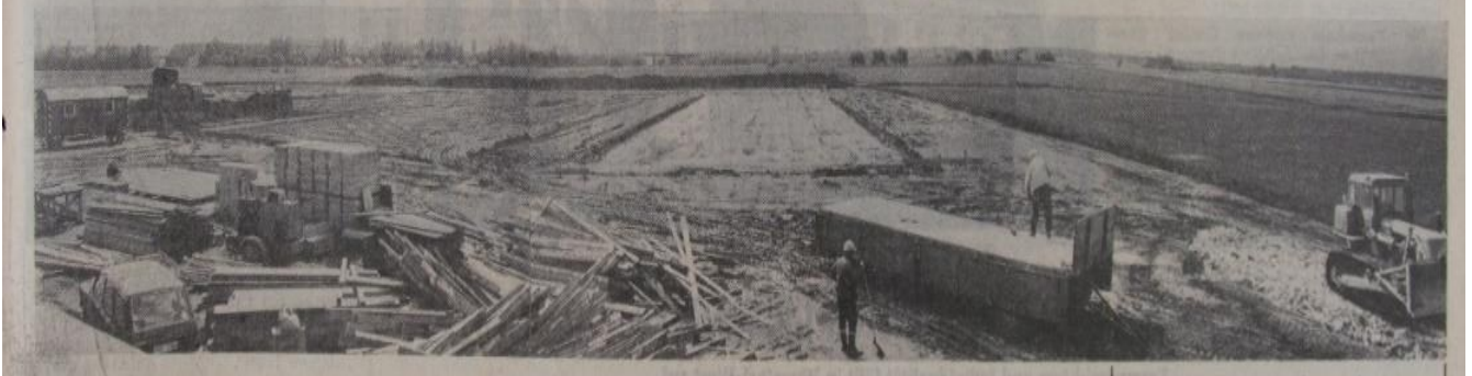
Man muss schon sehr genau hinsehen: Das erste Bild der KGS! 9.6.1972

Neustadt a. Rbge., Freitag, 9. Juni 1972