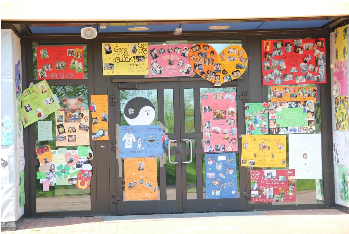
Schöne Tradition: Mutmachplakate zum Abitur

sei „weniger wert“. Im gleichen Jahr wurde an der KGS erstmals auch ein Ball der Sek I- Absolvent*innen gefeiert, womit eine gute Tradition begründet wurde. Und so manche*r tanzt auf zwei Bällen, denn rund ein Viertel unserer Abiturient*innen hat zunächst einen qualifizierten Realschulabschluss gemacht. Daran ist einer der Vorzüge des KGS-Systems zu erkennen: Die Durchlässigkeit. Sie ermöglicht den Wechsel zwischen den Schulzweigen ohne Schulwechsel.