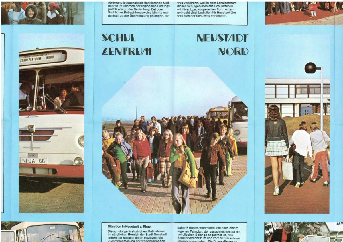
Flyer „Schulzentrum Nord“ 1974

Schutz der Moore in der Umgebung war und ist uns wichtig. Lange Jahre hat sich eine Schülerfirma damit beschäftigt und immer wieder ist das Thema Unterrichtsstoff und Anlass für Ausflüge, z.B. ins Tote Moor. Und nicht zuletzt beschäftigen wir uns schon seit 1999 mit BNE (Bildung für nachhaltige Entwicklung), fühlen uns damit den Nachhaltigkeitszielen der UN (SDG- Sustainable Development Goals) verpflichtet und sind bereits 1998 als Umweltschule erstmals zertifiziert worden. Durch die mehrjährige Teilnahme am kommunalen Klima+Wettbewerb konnte Energie gespart werden und mit dem gewonnenen Geld wurden weitere Energiesparmaßnahmen und Projekte finanziert.