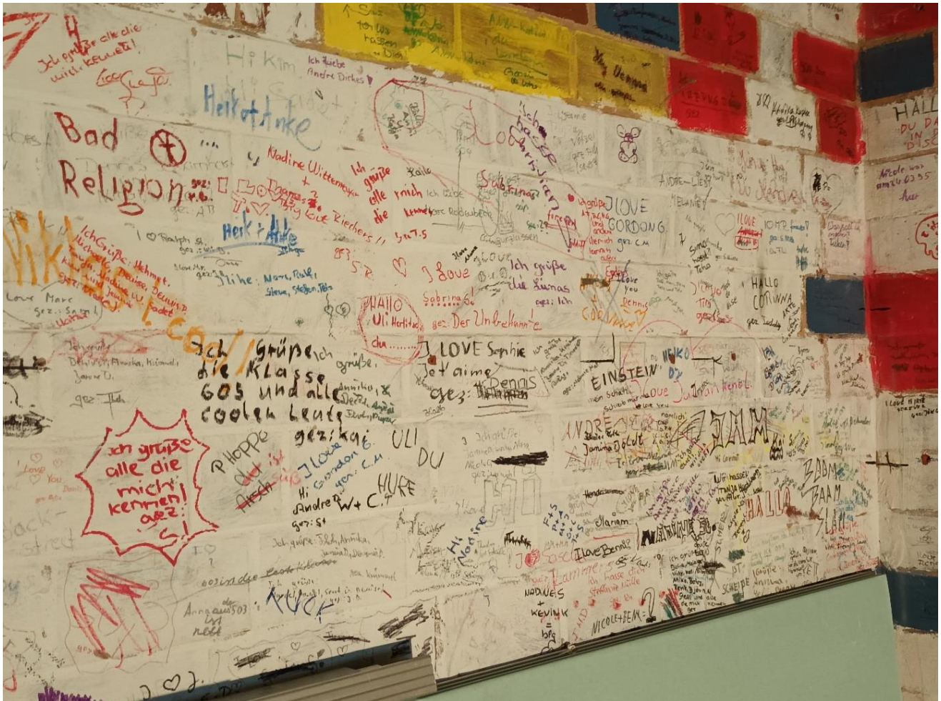
„Höhlenbilder“ aus der Disco, beim Umbau 2022 ans Tageslicht geholt.

unverzichtbare Stützen und sie sind bei der Organisation von Festen und Veranstaltungen unentbehrliche Leistungsträger. Die Rolle unserer Schulsozialarbeit ist seit langem auch als wichtiger Baustein der Jugendarbeit in Neustadt allgemein anerkannt. Die Jahrgangsräume (die früher Teestuben hießen) bieten Raum fürs Chillen, aber auch für Spiel und Party. Überhaupt darf der Spaß nicht zu kurz kommen, in der Schule wie im Leben. Eine gelungene Unterrichtsstunde ist im besten Fall auch ein Spaß für alle Beteiligten. Öfter noch denken viele Ehemalige aber wahrscheinlich an die Zeiten zurück, in denen eben kein Unterricht war: An all die Pausen , in denen gebolzt oder gerannt wurde, an die Ausfälle und Freistunden, in denen man im Freizeitbereich entspannen konnten oder in denen man sich heimlich davonschlich, ohne erwischt zu werden. Und ganz sicher ist auch das Lachen hier zu Haus, wo immer jemand einen Witz parat hat oder einfach komische Situationen entstehen. erinnert sich noch jemand an den Ruheraum, wo in der Mittagsfreizeit ein Nickerchen gehalten werden konnte?