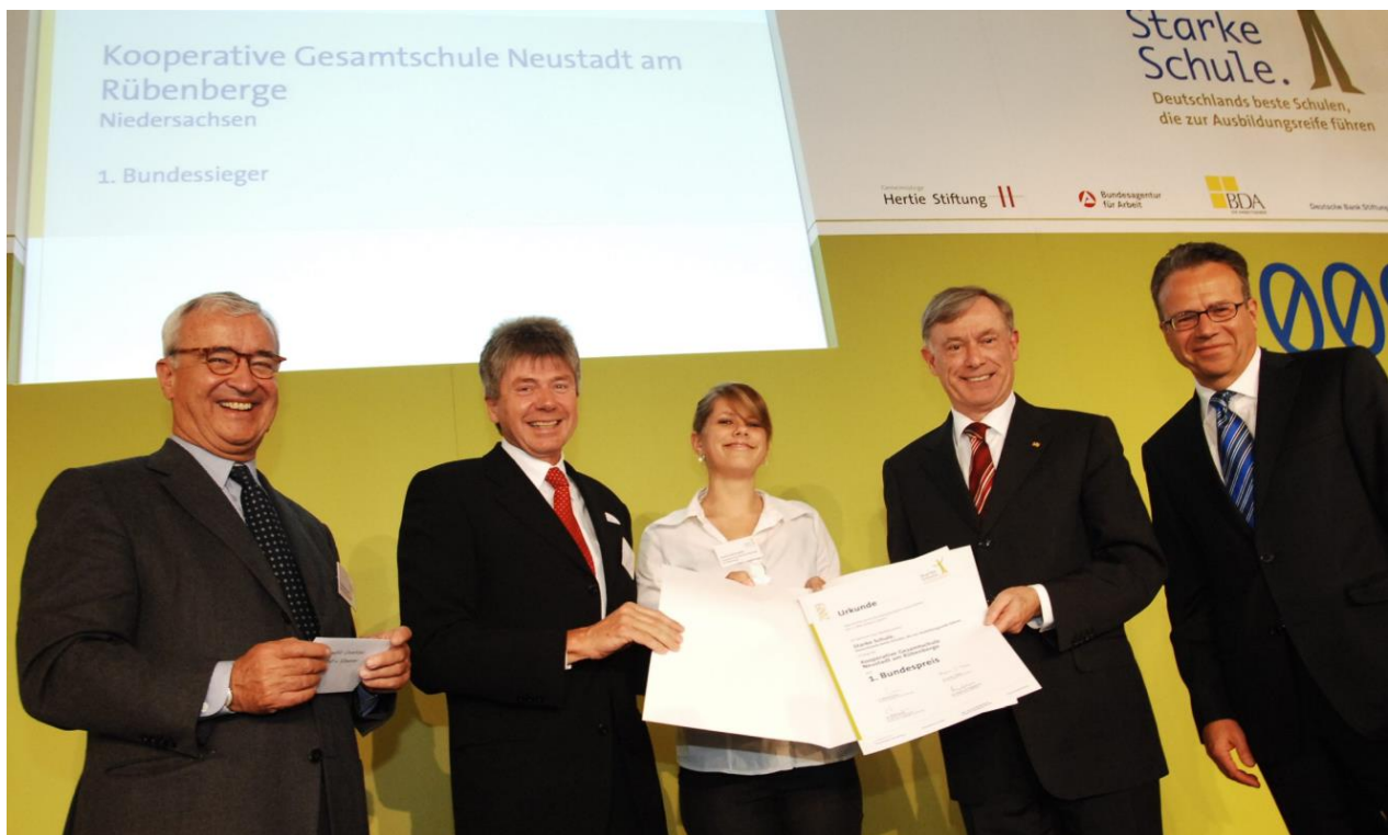
Verleihung des 1. Preises „Starke Schule“ der Hertie-Stiftung 2009

Besucht haben wir auch schon mehrfach unsere Abgeordneten im Bundestag. Im Gegenzug waren Ministerinnen und Minister bei uns zu Besuch, oft, wenn wir -mal wieder- einen Preis gewonnen hatten. Höhepunkt war hier der erste Preis der Hertie-Stiftung 2009, den wir gemeinsam mit der BBS für unser wegweisendes „Neustädter Modell“ gewonnen haben, das als Pioniertat eine Zusammenarbeit der beiden Schulen initiiert hat, die so erfolgreich ist, dass sie Eingang ins Schulgesetz gefunden und Maßstäbe in der Berufsvorbereitung der Haupt- und Realschüler*innen gesetzt hat. Das wurde mit etlichen weiteren Preisen und Auszeichnungen gewürdigt. All diese Ehrungen hatten zur Folge, dass wir häufig von der Presse, dem Radio oder von Fernsehteams besucht wurden, die Groß und Klein interviewten oder den Unterricht besuchten. Bemerkenswert, wie souverän sich die Kinder dabei wie echte Medienprofis benahmen.