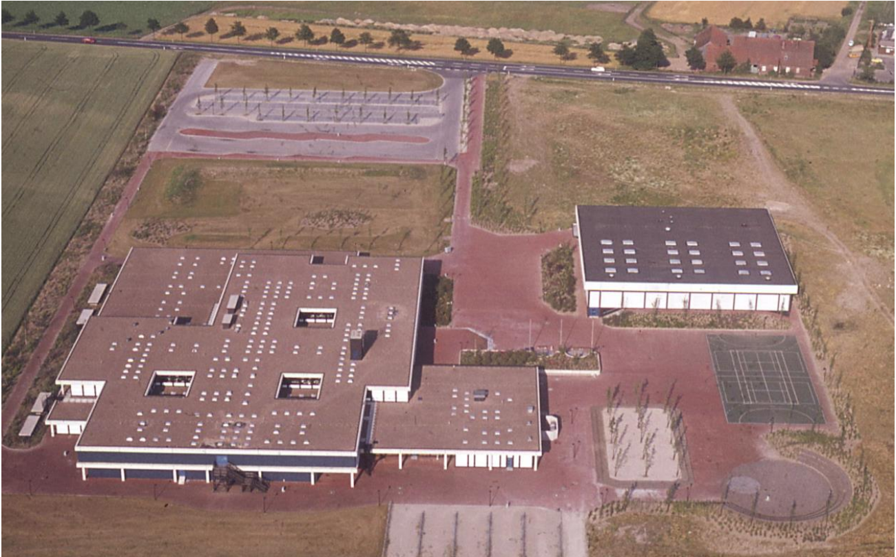
Keine Spanplattenfabrik: Schule, Sporthalle, Schulhof, Bushaltestellen, oben die Leinstraße, 1975

Bis 1991 werden alle Bauabschnitte vom Architekten Herbert Graff ausgeführt, der 1970 den Wettbewerb um den Neubau gewonnen hatte. Das Gebäude gilt als großer Wurf: solider Beton, neue Werkstoffe (Gipskartonplatten!), variable Leitungswege, Fachräume als Hörsäle und eine moderne, mutige Farbgestaltung (Grün! Orange! Blau! Gelb!) prägten das Bild. Der Bau wird bewusst mit nur einem Obergeschoss entworfen, um ihn nicht zu sehr als Fremdkörper in der Landschaft wirken zu lassen. Dieser Blick fehlte NDR- Moderator Reinhold Kujawa anlässlich der Feier zum 10jährigen Bestehen der KGS, als er sich an ein „Gebäude zur Spanplattenproduktion“ erinnert fühlte.