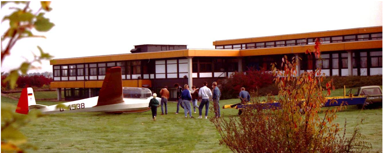
Gut gelandet. Segelflug-AG 1986