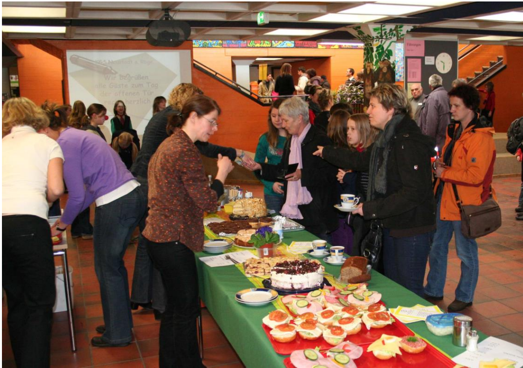
Tag der offenen Tür 2010

Unsere Jubiläen wurden ebenfalls zünftig begangen. Bisheriger Höhepunkt war die 20-Jahr-Feier mit 3000 Ehemaligen! Dabei fielen zwei Feststellungen, die hier unkommentiert bleiben sollen: