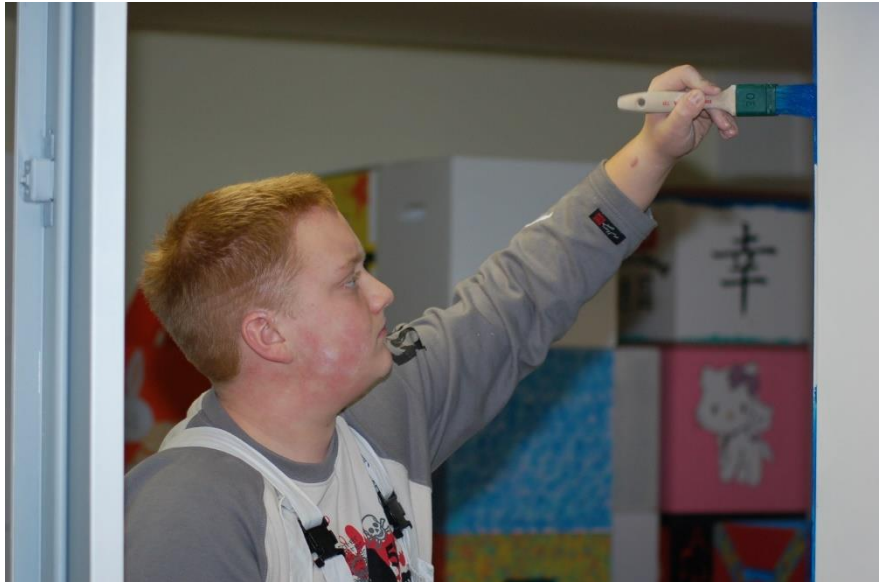
Mal was machen: Praxisunterricht im Neustädter Modell

Heute wird die Kooperation mit der BBS durch ein vielfältiges Angebot vor Ort ergänzt: Ein Berufsberatungsbüro in der Schule, täglich besetzt, ist ein echtes Highlight, dazu eine Studienberatung, Betriebsbeabende (seit 2007) oder -vormittage, an denen sich Ausbildungsbetriebe und künftige Auszubildende kennen lernen können und dazu eine regelmäßige Studien- und Berufemesse mit zuletzt über 80 Ausstellenden sind Angebote, von denen andere Schulen nur träumen können. Natürlich nehmen auch wir am Zukunftstag (früher Girls Day) teil, es gibt Schnupper- und längere Betriebspraktika und Betriebsbesuche. Mit Stolz können wir behaupten, unsere Schülerinnen und Schüler gut aufs Berufsleben vorzubereiten und Ihnen den Sprung ins kalte Wasser zu ersparen. Die Betriebe kennen unser Engagement und dementsprechend gern sucht man sein zukünftiges Personal bevorzugt in unserer Schülerschaft.