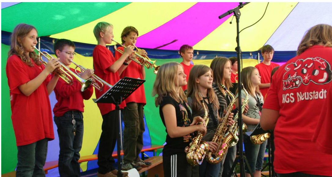
Auftritt der Bläserklasse 2007