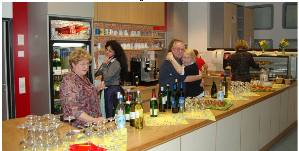
Der Magen? Das Herz? Auf jeden Fall ein lebenswichtiges Schulorgan: Die Cafeteria des Fördervereins.

Wer so viel macht, braucht auch mal Hilfe : Viele Angebote an der KGS sind nur durch die Unterstützung des regen und mitgliederstarken Fördervereins möglich, der 1982 mit zehn Mitgliedern klein angefangen hat. Schon in den ersten 20 Jahren hat er an der Schule Projekte und Anschaffungen mit gut 250.000€ finanziert! Wie oft sind die Fachbereiche bei Anschaffungen vom FÖV unterstützt worden? Wer macht die ganze Arbeit, wenn Musikinstrumente oder Taschenrechner ausgeliehen werden? Wer wickelt die Elternbeiträge für die betreuten Toilette ab? Wer sonst hat überhaupt eine betreute Toilette? Wer ist tragende Säule der Schulbuchausleihe? Wer kauft Kanus, Computer, Instrumente, Preise für Wettbewerbe, und, und, und? Wer hat 1998 für den Wasserspender in der Mensa gesorgt? Wer hat die erste Beachvolleyballanlage bezahlt? Wer organisiert seit 12 Jahren die Bücherbörse? Wer hat jahrzehntelang Partys und Abschlussbälle organisiert und durchgeführt? Wer hat den (inzwischen dritten) Kleinbus angeschafft, der seit 2007 Ausflüge und Transporte für AGs ermöglicht und der erst in diesem Jahr eine Probenfahrt gerettet hat, als der Reisebus nicht kam. Was wären wir ohne den Förderverein? Nicht auszudenken. Die KGS ohne Cafeteria? Mag man gar nicht dran denken. Und wer hilft dem Förderverein? Jedes Mitglied, alle, die in der Cafeteria kaufen und nicht zuletzt auch großzügige Spenden örtlicher Firmen.