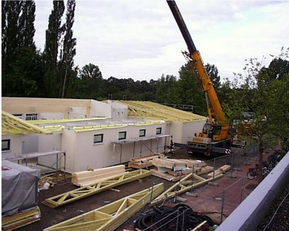
Bau des Musikpavillons 2010

Mit anderen Worten: Trotz 16 Jahre voller Preissteigerungen ist es gelungen, einen Musikbereich zu 60% des Quadratmeterpreises von 1994 zu errichten! Gut: Er ist nicht aus Stein, sondern aus Holz, aber er erfüllt alle heutigen Bedürfnisse an den Musikunterricht besser als der massive Bau und er widerspricht damit der gängigen Meinung, alles würde immer viel teurer als geplant, besonders bei öffentlichen Bauvorhaben. Hier ist, wie an vielen (Bau-) Stellen, ein Loblied der Zusammenarbeit mit Stadtverwaltung und Politik anzustimmen.