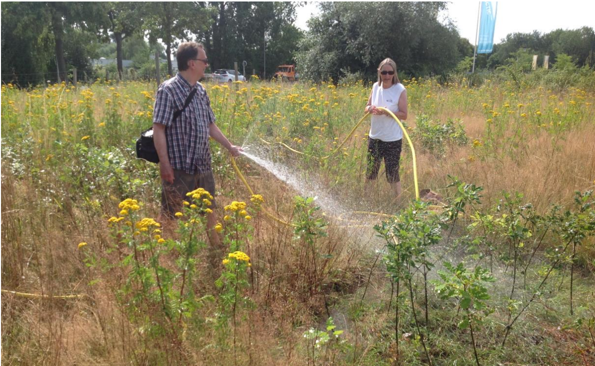
Rettung des frisch gepflanzten Klimawalds in der Sommerdürre 2019