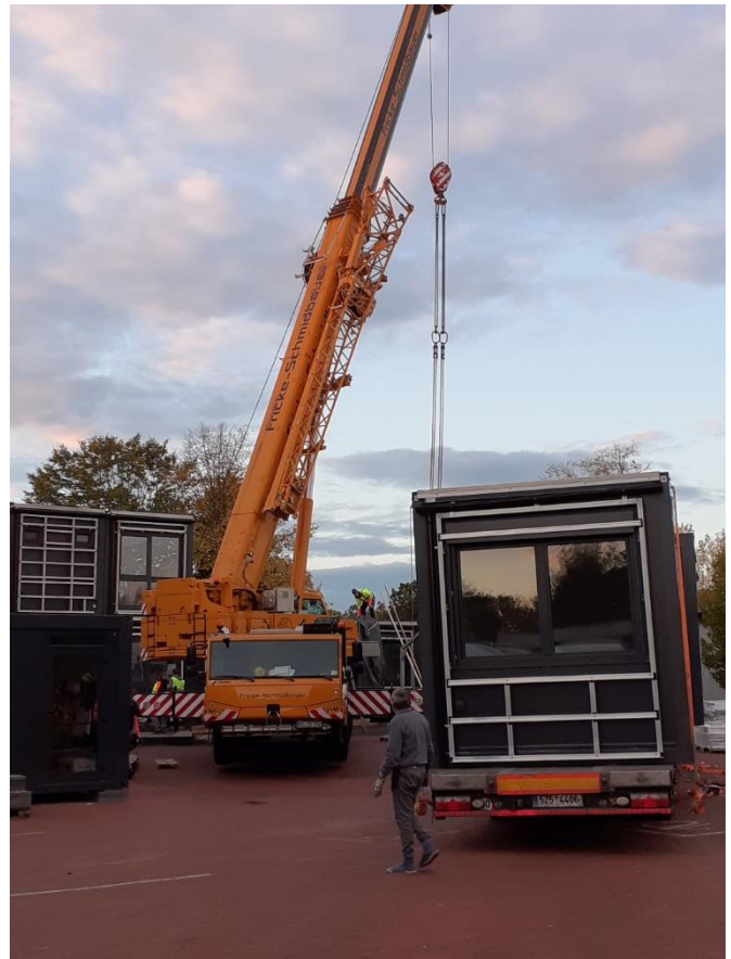
Haus L. L wie Lego. 2020

Wo gehobelt wird, fallen bekanntlich Späne, aber nicht überall, wo gebaut wird, müssen auch zwangsläufig Bäume fallen. Die Container stehen zwar mitten im „Grünen Klassenzimmer“, das zum 25-jährigen Schul- Jubiläum aus 25 Hainbuchen angelegt worden war. Es gelingt aber, die Container so zu platzieren, dass nur sieben Bäume weichen müssen und diese werden allesamt mit schwerem Gerät samt Wurzeln geborgen und auf dem Gelände umgesetzt. Keiner hat dabei Schaden genommen und alle erfreuen sich bester Gesundheit.