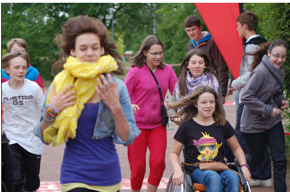
Sponsorenlauf 2012, alle machen mit