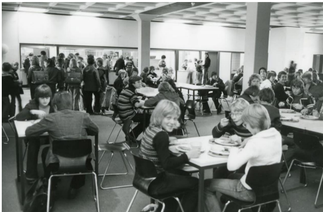
Mensabetrieb 1975, Bildarchiv Region Hannover ARH Slg. Bartling 2863

Und wo wir gerade beim leiblichen Wohl sind: Ohne die Mensa wollen wir auch nicht sein. Das starke Team hat inzwischen über 6 Millionen Portionen Essen gekocht! Kennt jemand eine erfolgreichere Gastronomie? Sie gilt als größte und erfolgreichste Schulmensa in Niedersachsen. Nach langer Unsicherheit über den Fortbestand der Mensaküche wegen der von der Stadt bemängelten Unwirtschaftlichkeit werden inzwischen auch Kitas und Grundschulen von hier aus mitversorgt und die Selbstständigkeit und hohe Qualität werden uns erhalten bleiben, wenn auch zu einem künftig höheren Preis, den der Rat im Frühjahr 2024 beschlossen hat. Die Karte bietet neben einem vegetarischen Gericht neuerdings auch veganes Essen an und nicht zuletzt durch das riesige Salatbuffet ist hier wirklich jeden Tag für jede und jeden was dabei! Sogar mit einem Lob der Verbraucherzentrale darf sich die Küche seit 2016 schmücken. Wer lieber selbst kocht, findet in den Lehrküchen des Hauswirtschaftsbereichs alles vor, was dazu nötig ist, inklusive fachkundiger Anleitung. Wem all das noch nicht genug Auswahl ist oder wer Schokolade zum Nachtisch möchte, dem sei der 2018 gegründete Fair-Trade-Kiosk oder der Fair-Trade-Automat empfohlen. Hier muss niemand hungern.